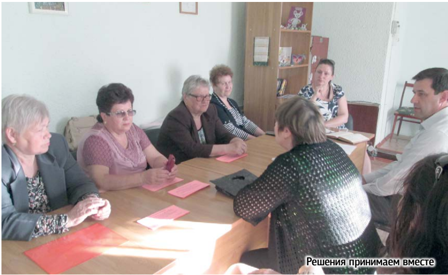
Решения принимаем вместе

Сегодня мы рассказываем о том, как в Волгодонске развиваются ТОСы, одна из популярных форм местного самоуправления