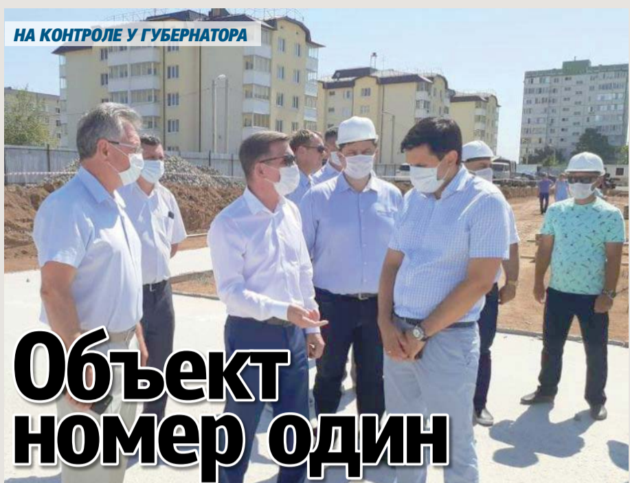
НА КОНТРОЛЕ У ГУБЕРНАТОРА