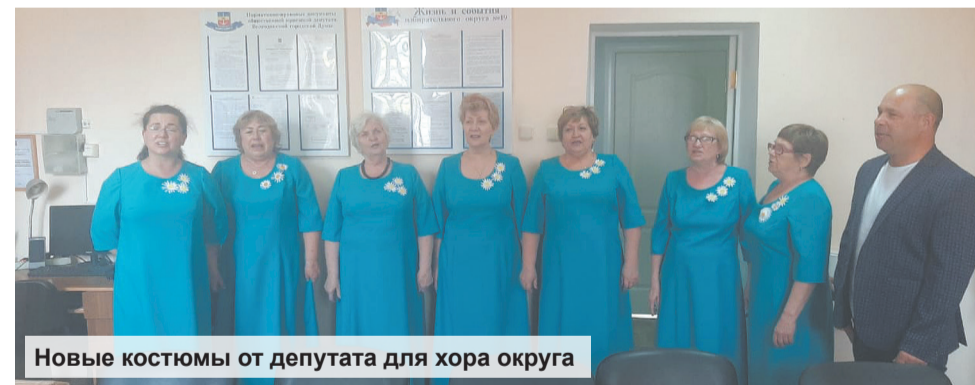
Новые костюмы от депутата для хора округа