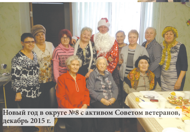
Новый год в округе №8 с активом Советом ветеранов, декабрь 2015 г.