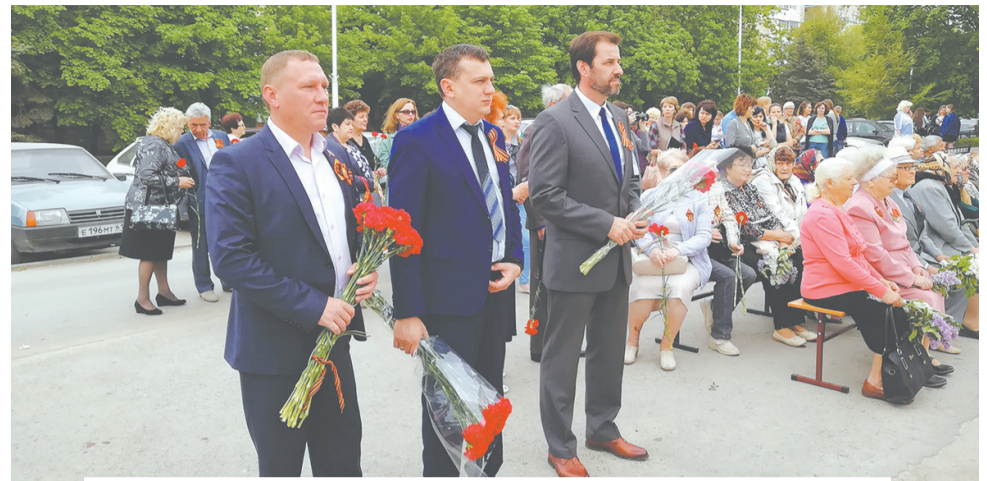
Возложение цветов - дань памяти и уважения погибшим защитникам Родины

Политсовет Волгодонского отделения партии СПРАВЕДЛИВАЯ РОССИЯ