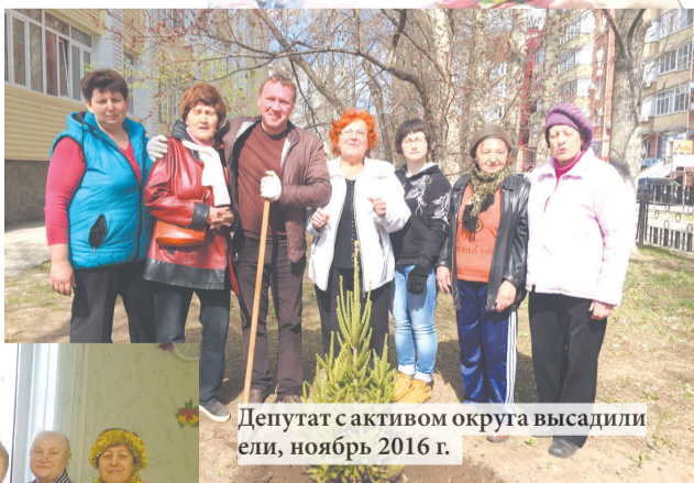
Депутат с активом округа высадили ели, ноябрь 2016 г.