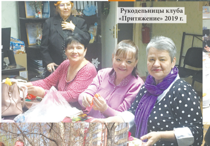
Рукодельницы клуба «Притяжение» 2019 г.