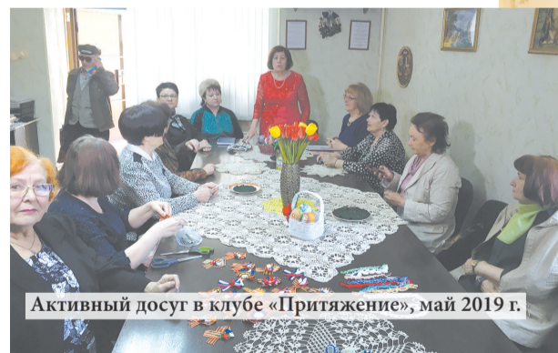
Активный досуг в клубе «Притяжение», май 2019 г.