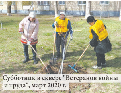
Субботник в сквере «Ветеранов войны и труда», март 2020 г.