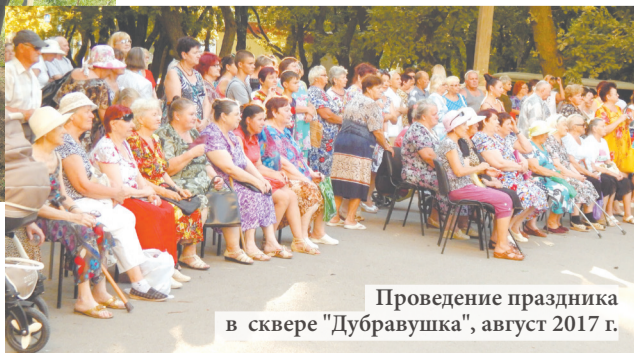
Проведение праздника в сквере «Дубравушка», август 2017 г.