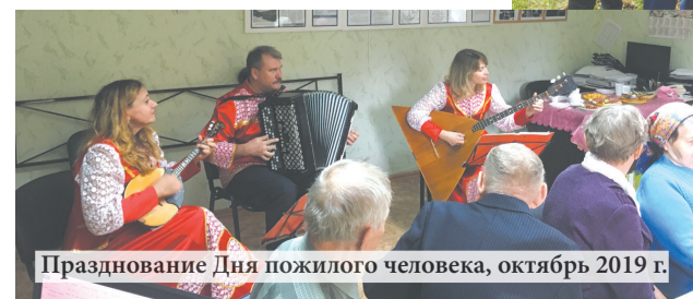
Празднование Дня пожилого человека, октябрь 2019 г.