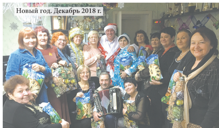
Новый год. Декабрь 2018 г.