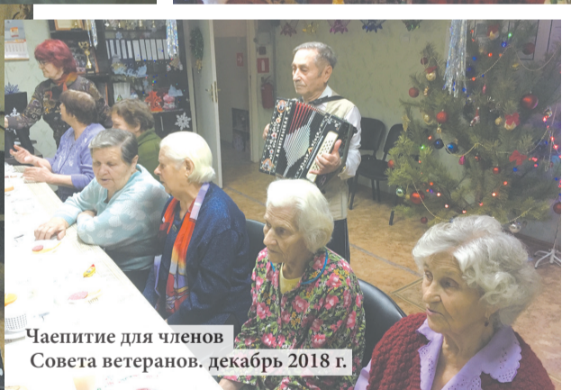
Чаепитие для членов Совета ветеранов. декабрь 2018 г.