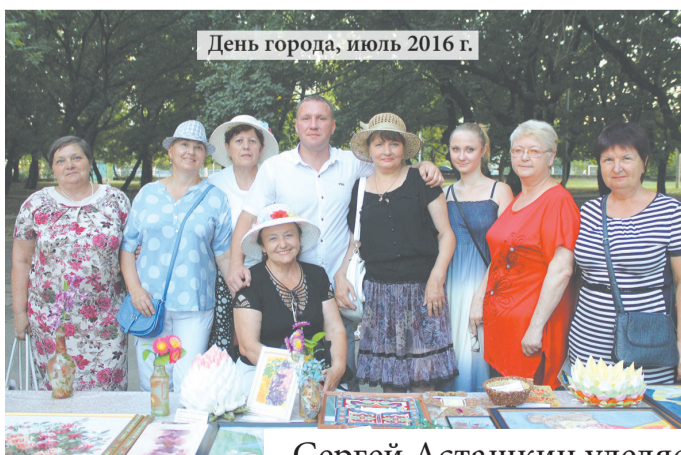
День города, июль 2016 г.