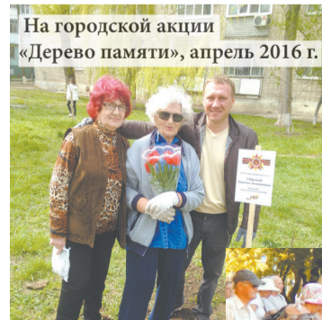
На городской акции «Дерево памяти», апрель 2016 г.