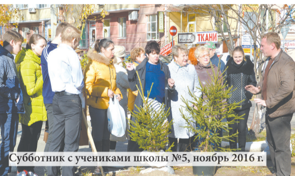
Субботник с учениками школы №5, ноябрь 2016 г.