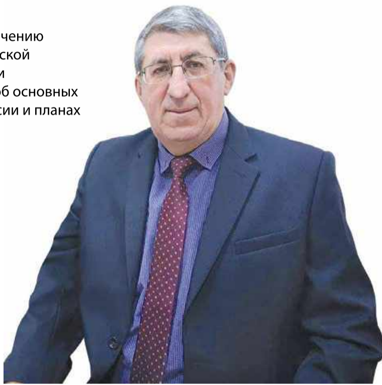
Александр Бужак считает, что наркоситуация в регионе в целом стабильная, но проблема наркомании требует повышенного внимания

– Да, но работать еще есть над чем. В 2022 году было выявлено более 5,7 тысячи преступлений, связанных с незаконным оборотом наркотиков, изъято свыше 193 кг наркотиков, пресечено почти 3,7 тысячи административных