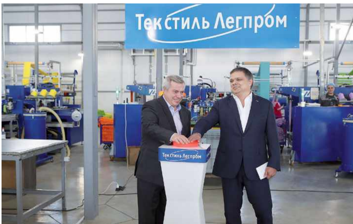
Открытие новых предприятий – большой вклад в развитие экономики всего региона