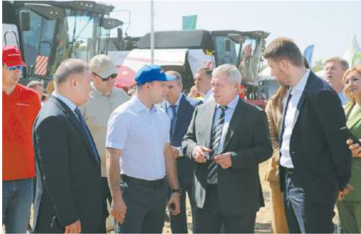
Ростовская область практически готова начать битву за урожай-2023

Самый большой парк сельхозтехники в стране сегодня, как из-