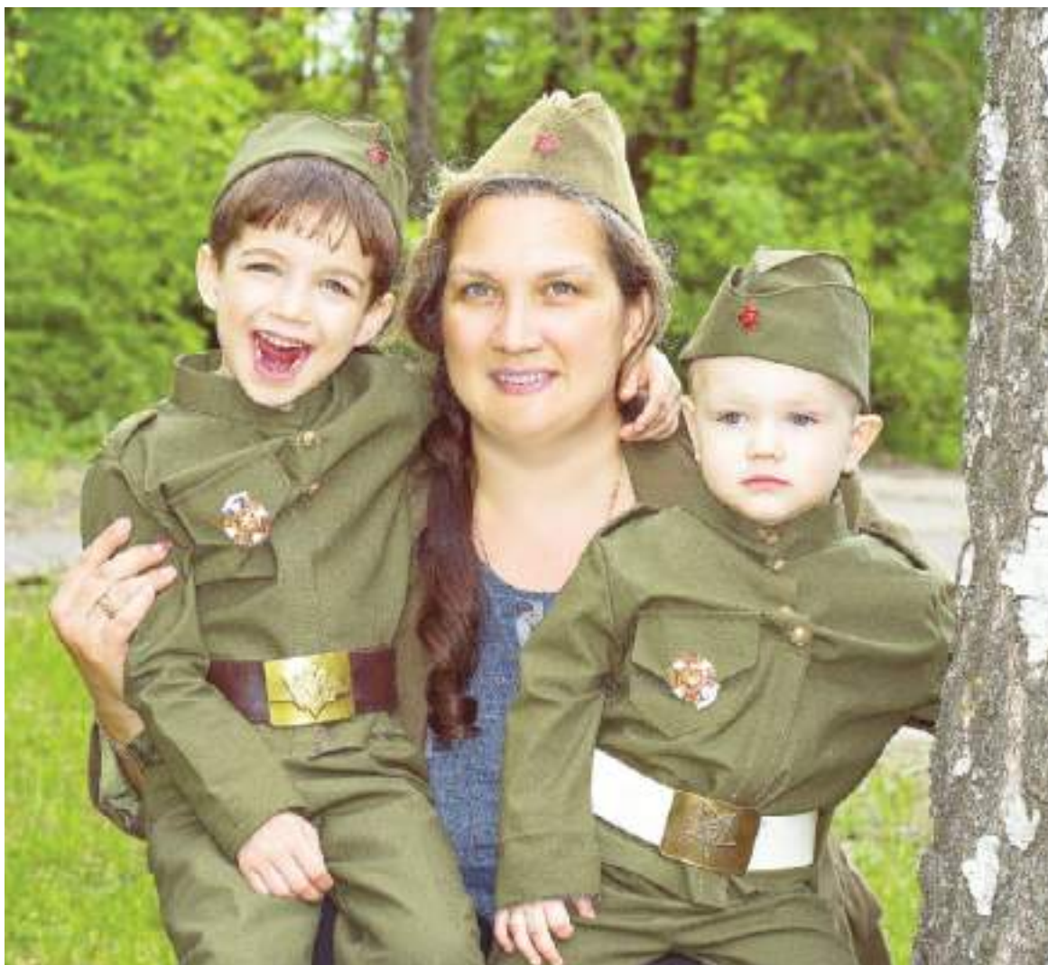
НИКТО, КРОМЕ НАС!