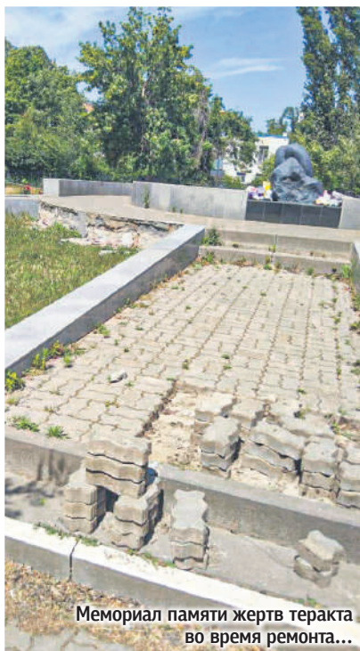
Мемориал памяти жертв теракта во время ремонта...