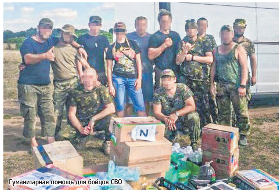
Гуманитарная помощь для бойцов СВО