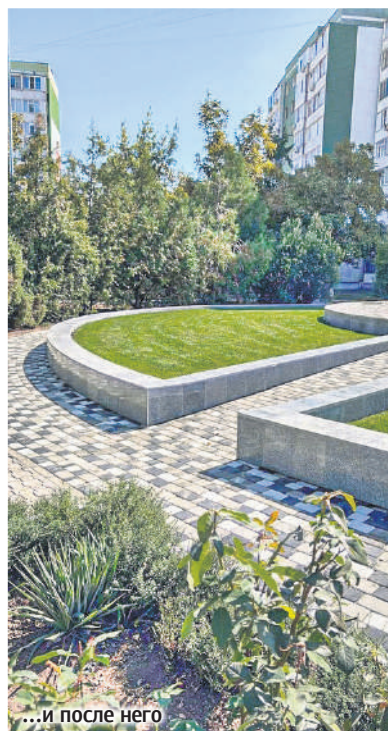
...и после него

действующими лицами празднования Дня города в микрорайоне стали семьи: супруги, прожившие в браке много лет; многолетние пары; семьи, активно занимающиеся помощью бойцам СВО и их родным. Артисты из ДК имени Курчатова организовали для жителей микрорайона концертную программу, актив округа – выставку рукоделия, библиотека № 6 – книжную выставку и занимательные игры. Депутат же обеспечил сладкое угощение для всех желающих.