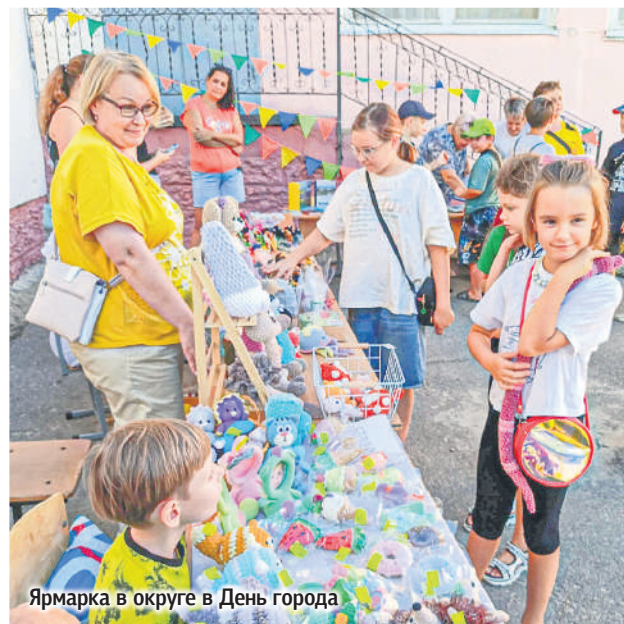
Ярмарка в округе в День города

И все же о родных людях забывать тоже нельзя. Так, главными