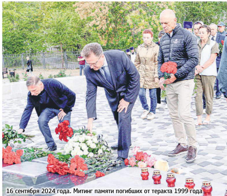
16 сентября 2024 года. Митинг памяти погибших от теракта 1999 года

Наверное, никогда еще жители округа и всего города не были настолько сплочены. Помощь нашим землякам, участвующим в специальной военной операции России на территории Украины, для многих волгодонцев стала чем-то большим, чем работа и общественная деятельность – тем, что приближает нашу победу и долгожданный мир.