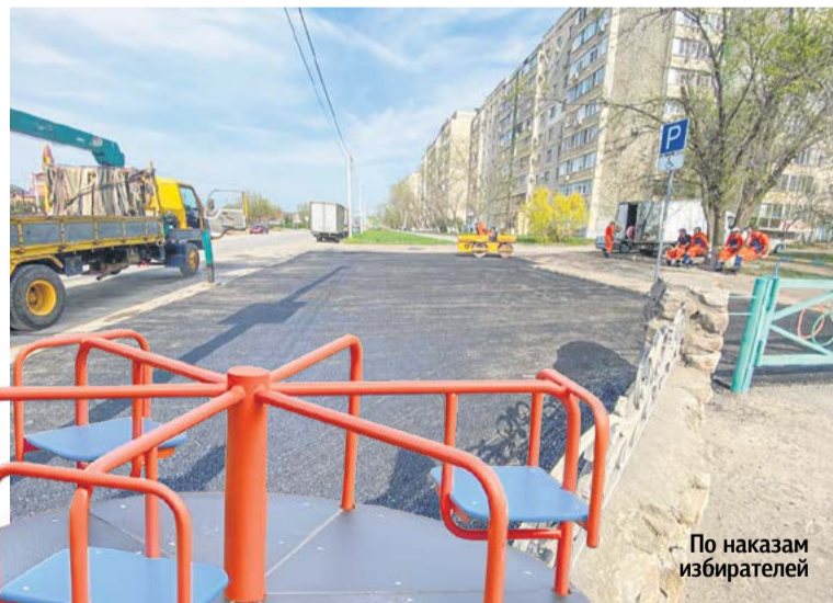
По наказу избирателей