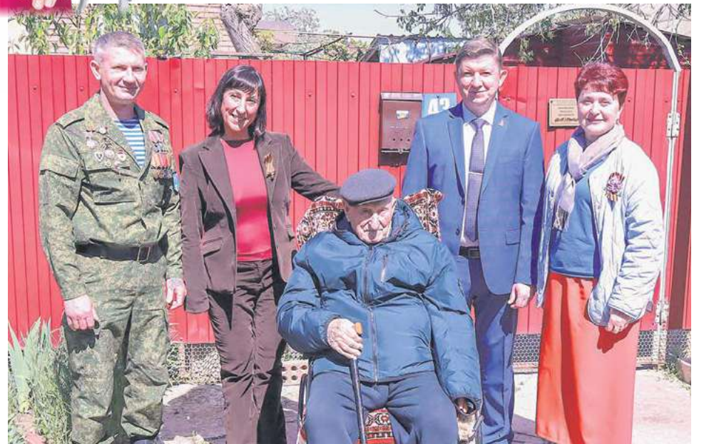
Перед Днем Победы-2025