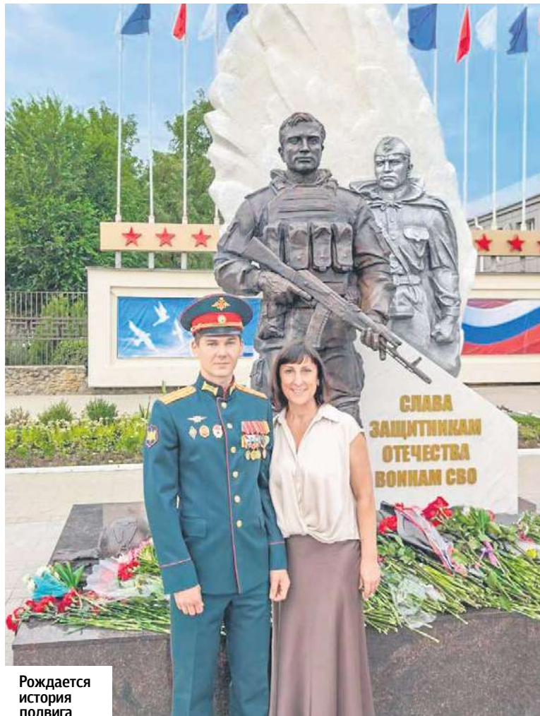
Рождается история подвига