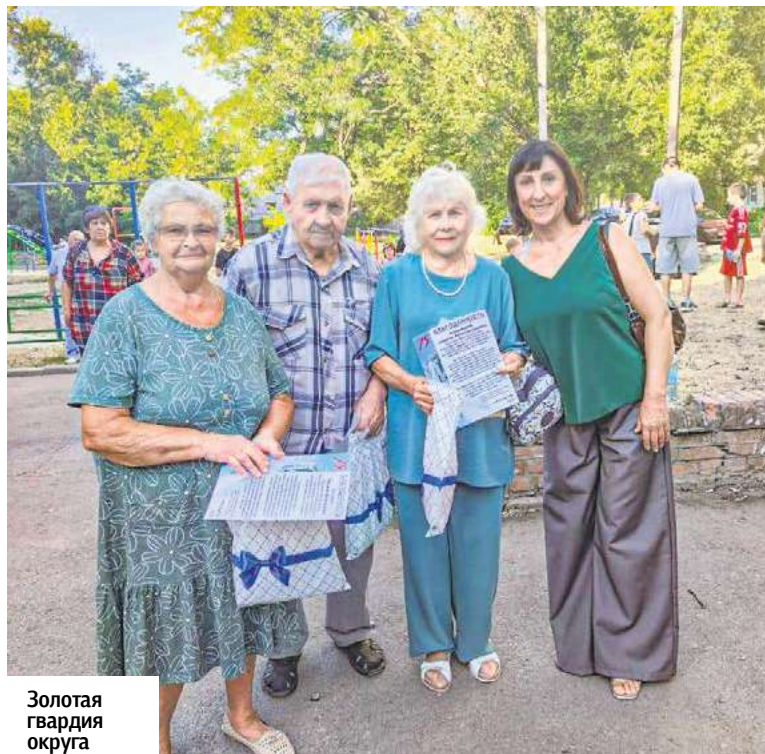
Золотая гвардия округа