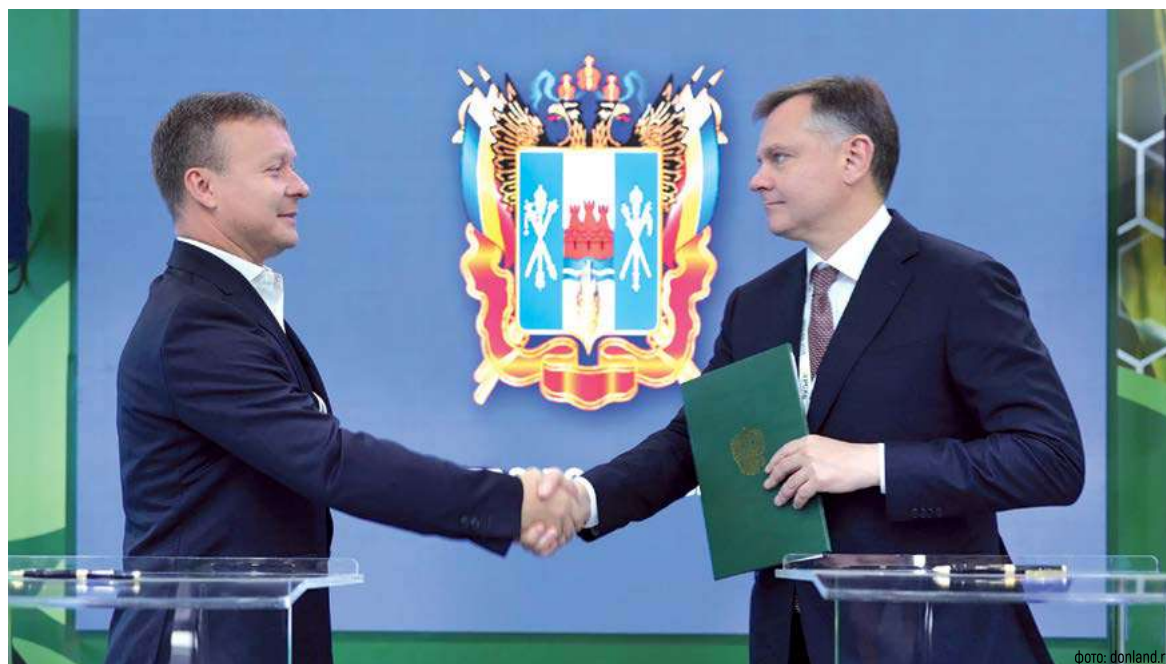
Подписанные соглашения отражают намерение Ростовской области и в дальнейшем развивать сельское хозяйство, а также переработку сельхозпродукции

В настоящий момент компания оформляет земельный участ-