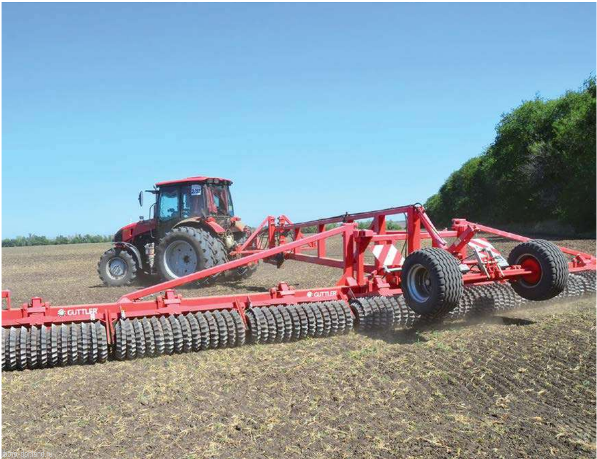
Осенние работы на донских полях идут полным ходом. Сейчас закладывается фундамент урожая-2026

Наполовину завершена и жатва зерновых культур поздних сро-