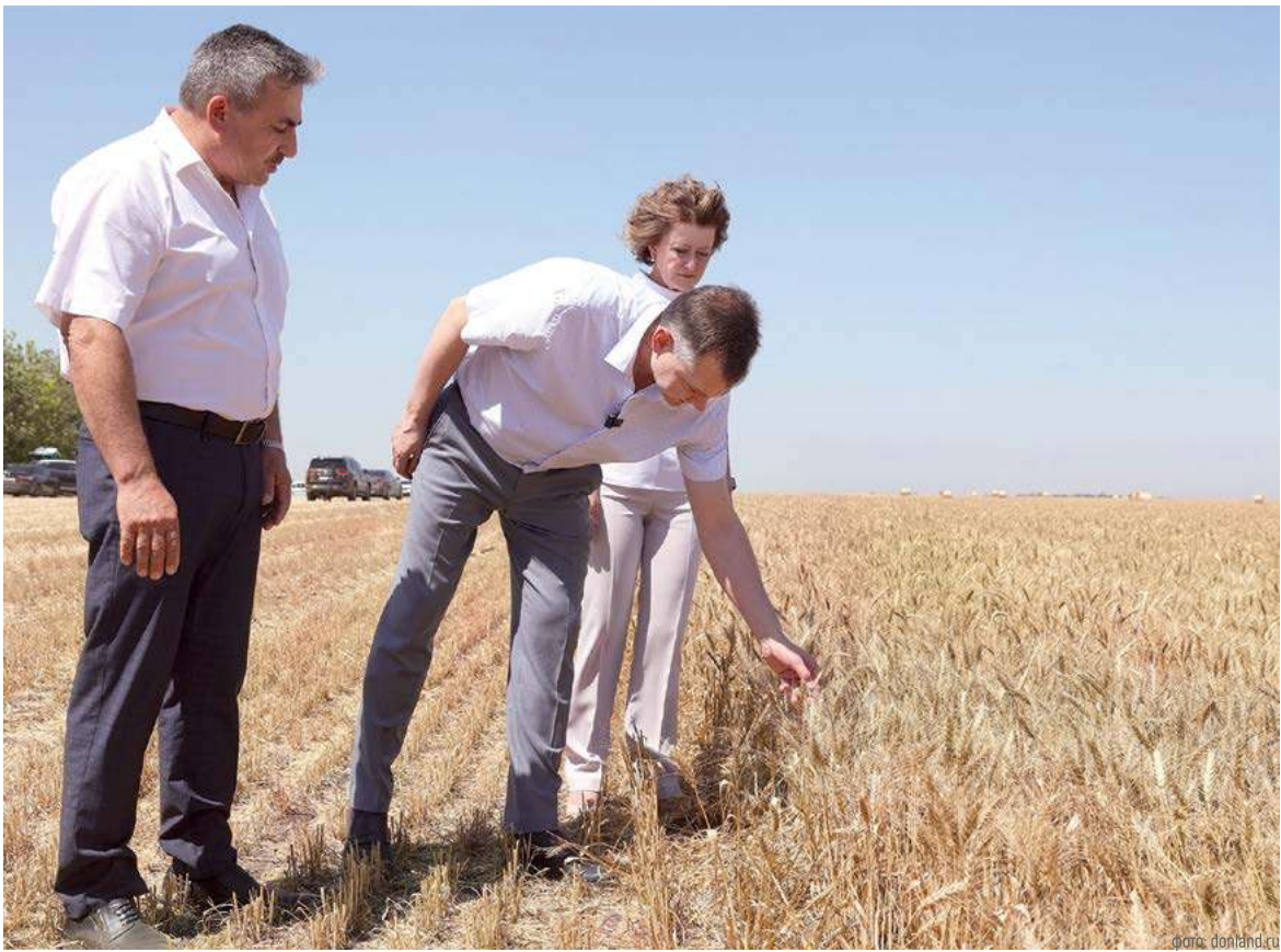
Потенциал АПК огромен, но в меняющихся условиях ему нужна помощь новых технологий

А влага будущему урожаю нужна уже сегодня, поэтому на Дону для обеспечения благоприятных условий созревания зерновых было принято решение впервые применить технологии искусственного вызывания осадков.