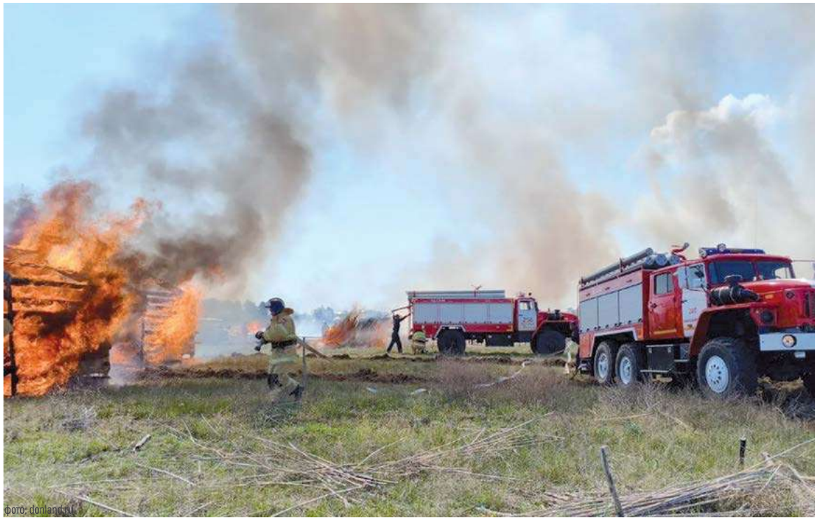
Донские огнеборцы ликвидируют возгорания в нормативные сроки

В лесах Ростовской области пожароопасный сезон был введен в