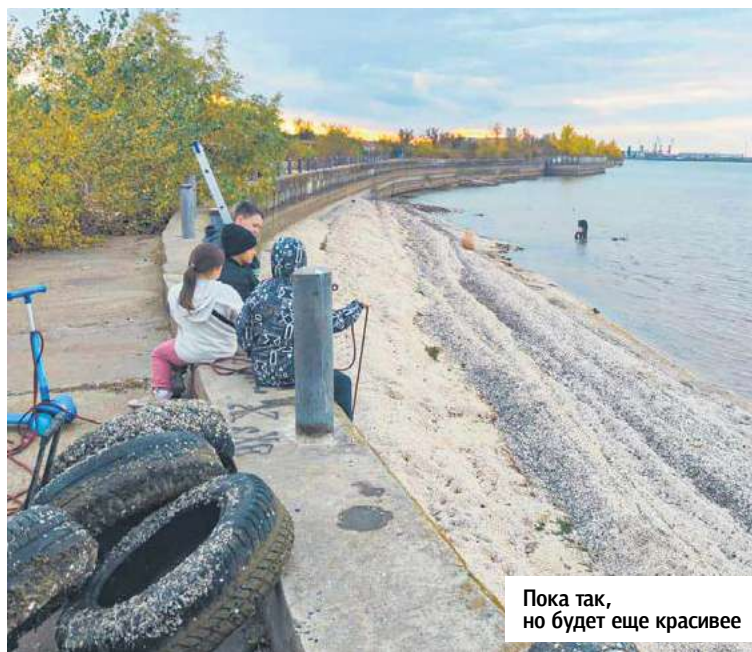
Пока так, но будет еще красивее