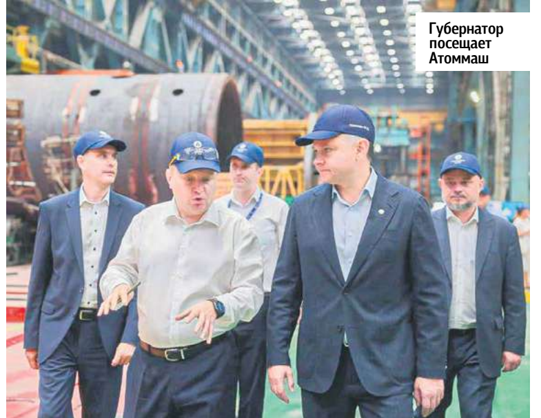
Губернатор посещает Атоммаш