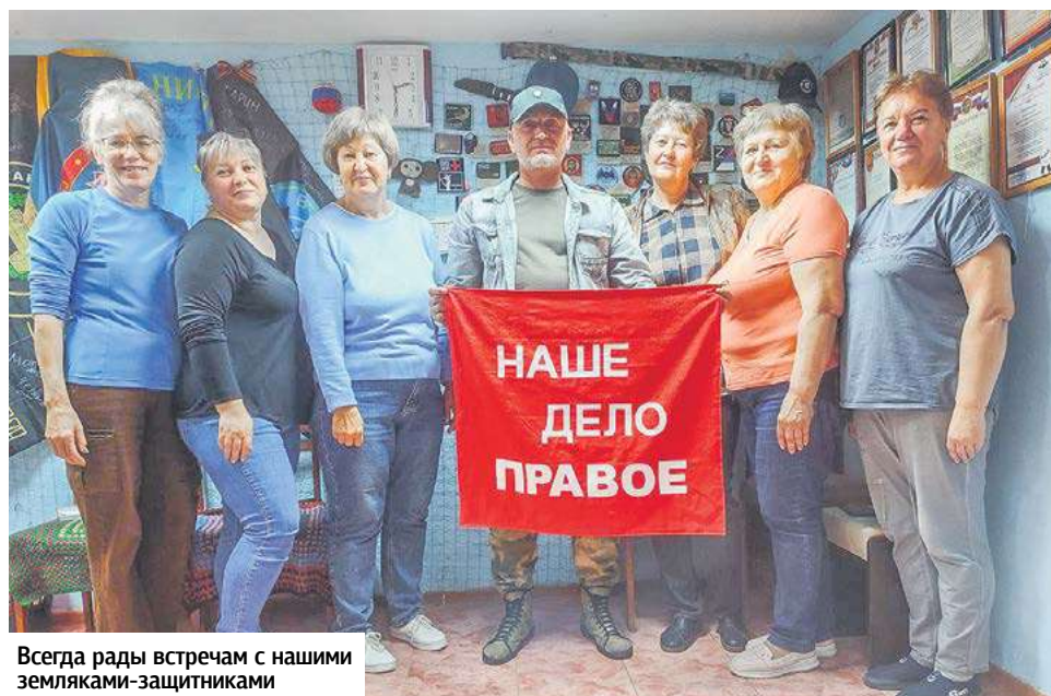
Всегда рады встречам с нашими земляками-защитниками

Одно все знают точно: в каждом пакетике, в каждой коробке, в каждом стежочке, в каждой петельке есть частица душевного тепла и любви каждого добровольного помощника группы «От всей души».