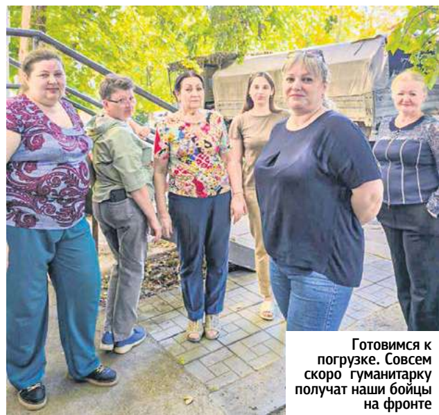
Готовимся к погрузке. Совсем скоро гуманитарку получат наши бойцы на фронте