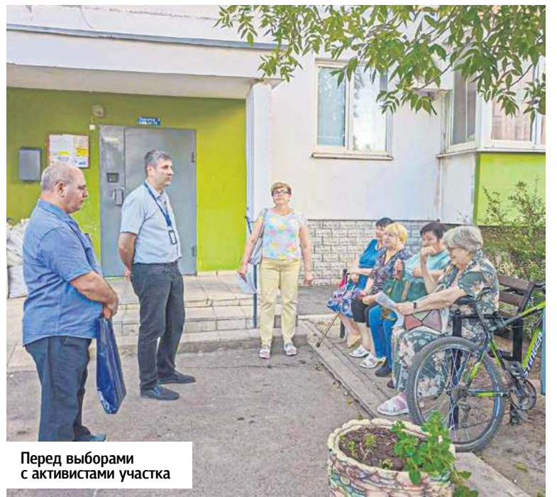
Перед выборами с активистами участка

ство с этой территорией, общение с жителями стало тревожным сигналом к быстрому реагированию. Люки! Масса канализационных люков у школы да и по всему району, кое-как прикрытых хлипкими деревяшками. Разрушенная канализационная магистраль на проспекте Лазоревом. Целый список МКД по сути без дворов, нормальных проездов. Ни одной точки с мало-мальски обустроенной инфраструктурой общего пользования – нет сквера, кафе, библиотеки... Перечислять эти «не» дальше не хочется. Депутат знает каждый проблемный адрес. Это – основа его программы: