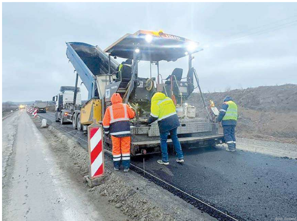
Дорожные работы в Ростовской области выполняются по графику

В новом году правительство Ростовской области планирует провести работу над тарифами на межмуниципальные маршруты и развитием сети дачных направлений.