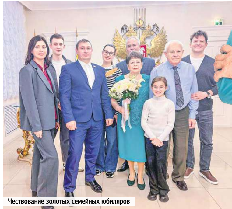
Чествование золотых семейных юбиляров

«зеленый пожар» быстро «потушили», скосив сорняки.