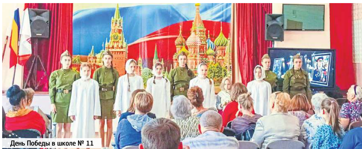
День Победы в школе № 11