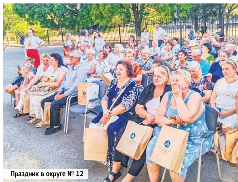
Праздник в округе № 12