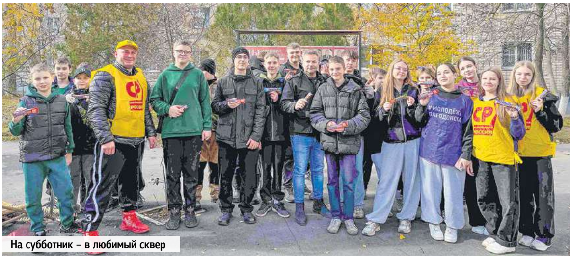
На субботник – в любимый сквер