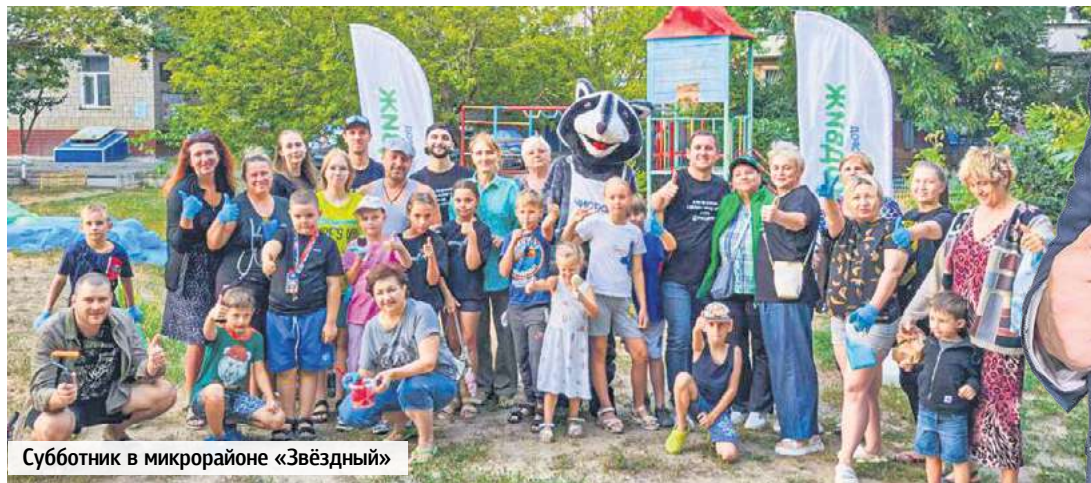
Субботник в микрорайоне «Звёздный»

Молодой, энергичный, без пафоса и иллюзий. Ведущий инженер цеха централизованного ремонта Ростовской АЭС, он спокойно произносит фразу, не вписывающуюся в заезженные стереотипы: «Депутат – это не власть, а дополнительная ответственность и, честно говоря, «головная боль». Но я сам этого хотел».