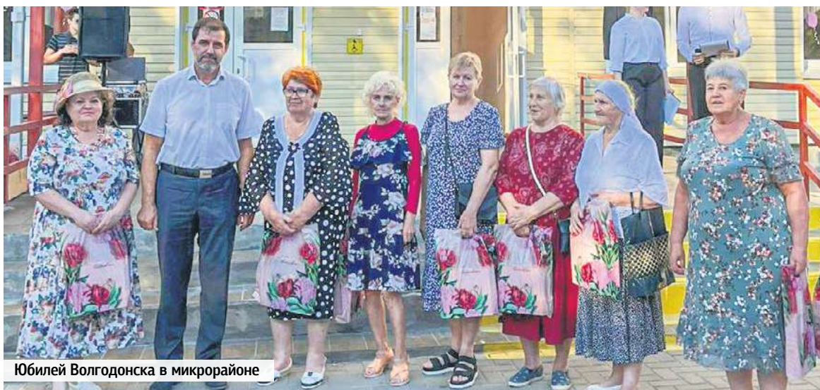
Юбилей Волгодонска в микрорайоне

«Степной» всегда был и остается в сфере особого внимания. Здесь постоянно выполняются работы по благоустройству, и нынешней осенью жители вместе с управляющей компанией «Домжилсервис» дружно потрудились – убрали ветки, опавшие листья, мусор, обновили озеленение. А весной субботник в округе прошел на улице Пионерской – навели чистоту на ее участке от улицы Степной до переулка Дзержинского.