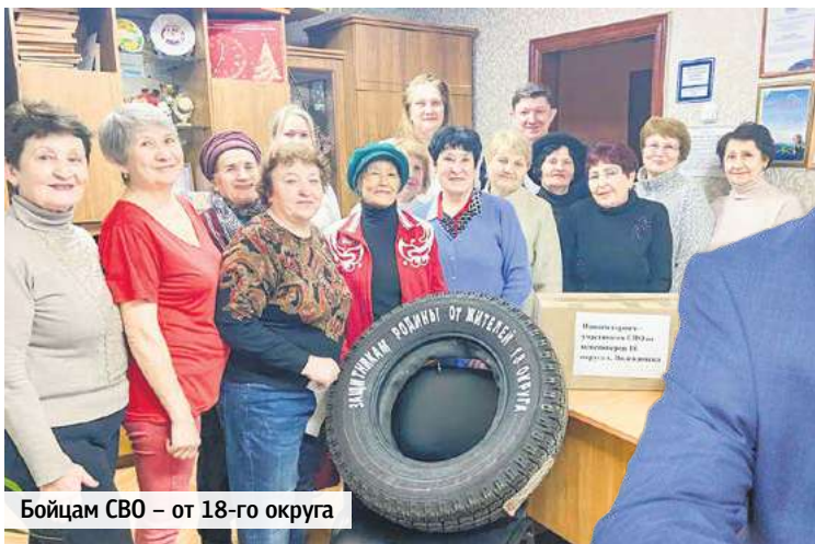
Бойцам СВО – от 18-го округа