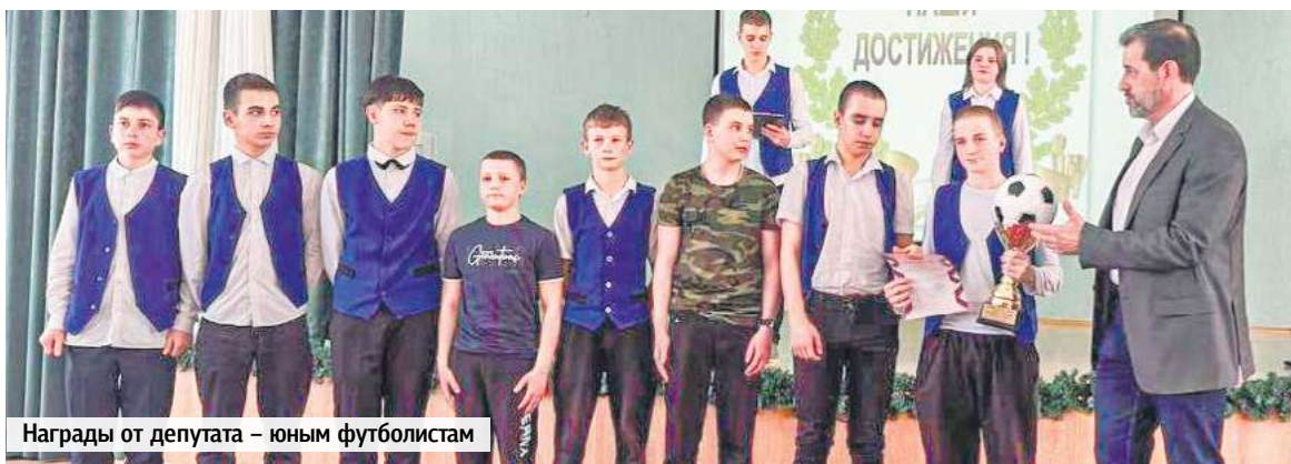
Награды от депутата – юным футболистам

А пока мы готовимся встретить новый 2026 год. И верим, что он принесет нам хорошие вести, надежду на лучшее, станет чистым листом, на котором мы напишем новую страницу. Хочу искренне поблагодарить актив микрорайона, всех жителей за неравнодушие, помощь и поддержку, за то, что много лет мы рука об руку стараемся сделать наш округ лучше и краше. И в наступающем году мы обязательно постараемся выполнить то, что запланировали сегодня.