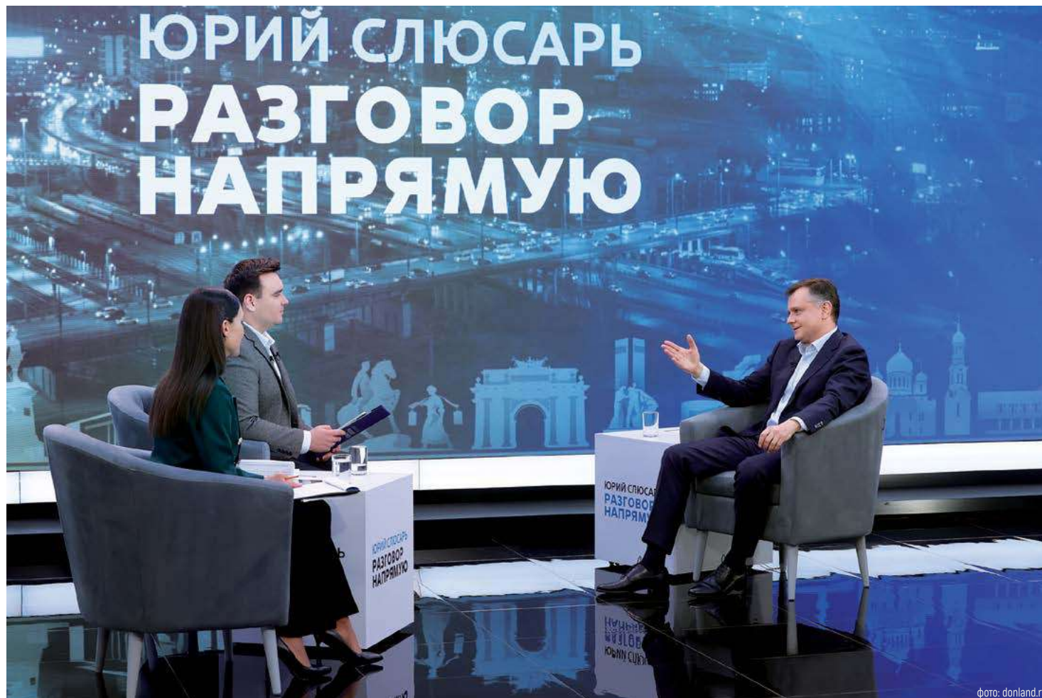
Прямая линия губернатора Юрия Слюсаря нашла отклик у жителей региона, которые смогли обратиться к нему с самыми актуальными и волнующими вопросами

– Провели обследование, здание признали аварийным, снесли, начали возведение нового модульного. И вот по тем обещаниям, которые минтранс транслирует, там 1 апреля 2026 года должен открыться новый современный вокзал с залом ожидания, камерами хранения и всей необходимой инфраструктурой, – уточнил глава региона.