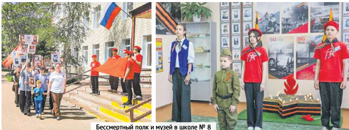
Бессмертный полк и музей в школе № 8