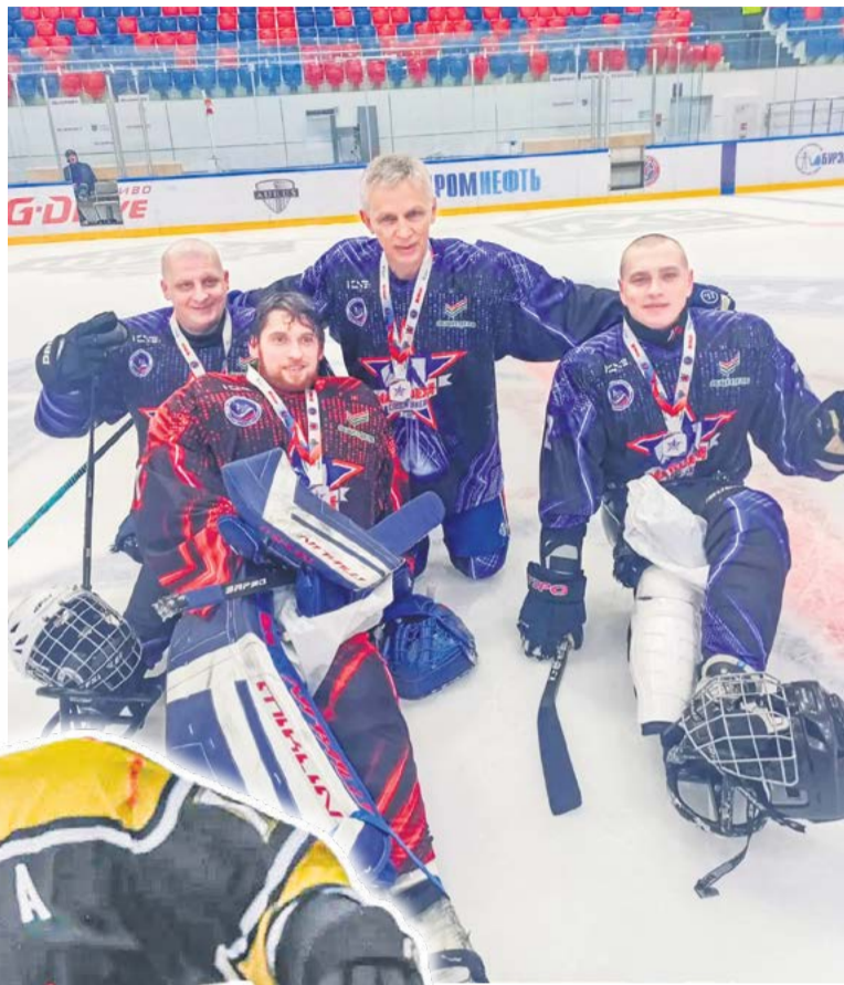
Санкт-Петербург-2025. На матче звезд КХЛ с известным советским и российским хоккеистом, тренером Игорем Ларионовым (в центре)

«В восемь утра дали команду на штурм. Но как только мы зашли в одно из крыльев здания, противник его взорвал. На нас упали два этажа. Пацанов завалило, а мне придавило ногу. Никого рядом. Оказал себе первую помощь. Понял, что нога полностью перебитая, но плиту мне не сдвинуть. У всех штурмовиков на груди висит одна граната. Я от страха схватил ее. Все, думаю, буду взрывать. Потом подумал – зачем? Тяжело было принять решение. Вот и сидел я с этой гранатой. С восьмью утра до пяти вечера. Вспомнил всех – маму, папу, сестер... И начал раскапывать ногу, где-то подкапывать, чтобы ее согнуть. Разрыл, увидел, что держится она только на кусках кожи и мышц. Пришлось ее рвать, доламывать, отрезать куском плетки... Мне повезло, что было минус 12 градусов, холодно».