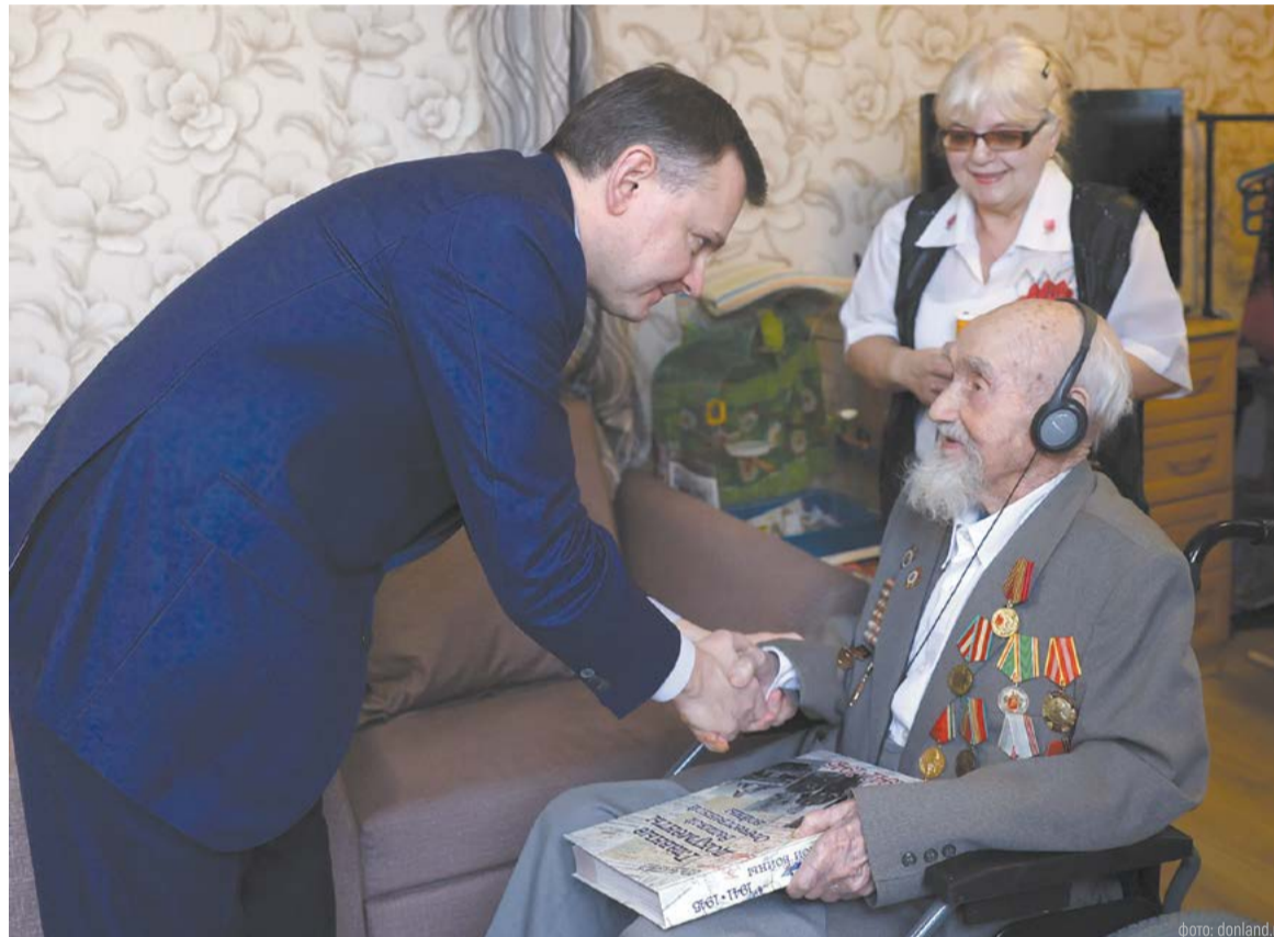
Работа о ветеранах Великой Отечественной войны – общая задача. Они живые хранители памяти о великом подвиге и Победе

рублей участникам и инвалидам Великой Отечественной войны доставят вместе с апрельской пенсией, обращаться никуда не нужно. В этом году выплату ко Дню Победы отделение СФР по Ростовской области назначило 168 ветеранам.