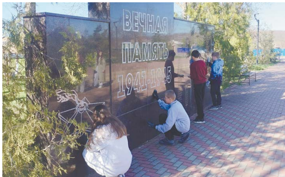
В районах области силами молодежи и неравнодушных жителей уже обновлено более 300 мест памяти – мемориалов с именами участников Великой Отечественной, захоронений героев войны, памятников, посвященных их подвигам

В преддверии 81-й годовщины Победы в Великой Отечественной войне в Тарасовском районе планируется высадить 80 деревьев березы в честь 13 Героев Советского Союза.