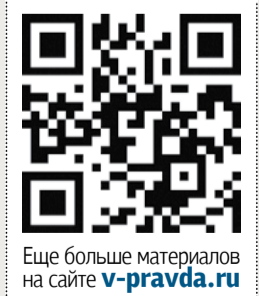
Еще больше материалов на сайте v-pravda.ru

Футбольный клуб «Волгодонск» свой первый матч проведёт с командой «Заря-2» (Луганск, ЛНР) на поле соперника. Кубок губернатора – Чемпионат Ростовской области 2026 года по футболу в высшей лиге стартовал 4 апреля игрой команд «Металлург» (Алчевск, ЛНР) и ФК «Торпедо» (Таганрог). Со счётом 2:1 выиграла команда из Таганрога.