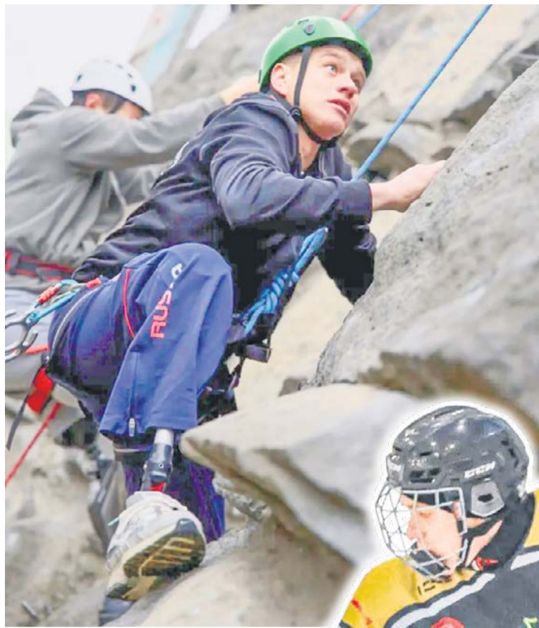
Учебный скалодром. Испытание возможностей